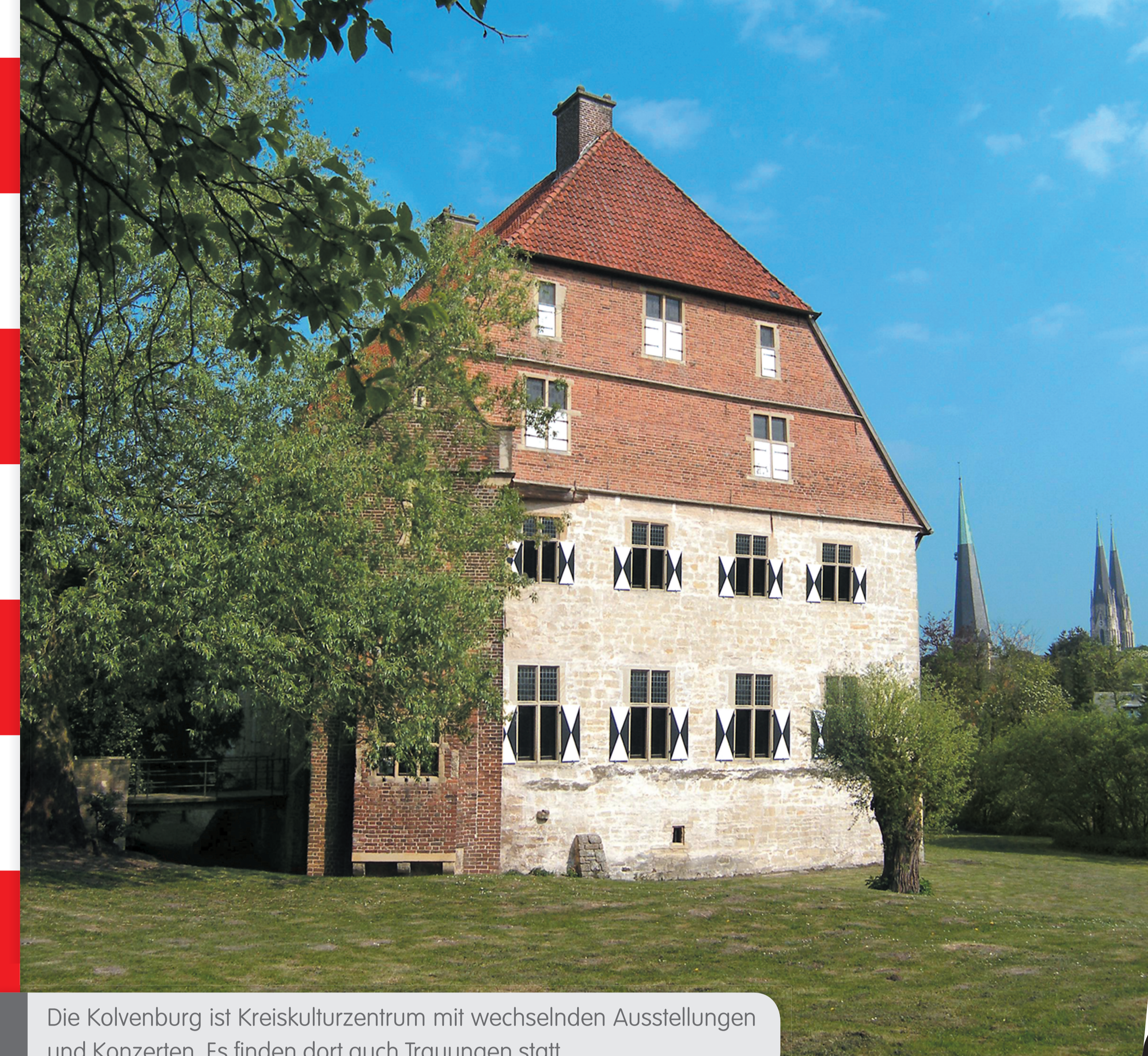
Die Kolvenburg ist Kreiskulturzentrum mit wechselnden Ausstellungen und Konzerten. Es finden dort auch Trauungen statt.