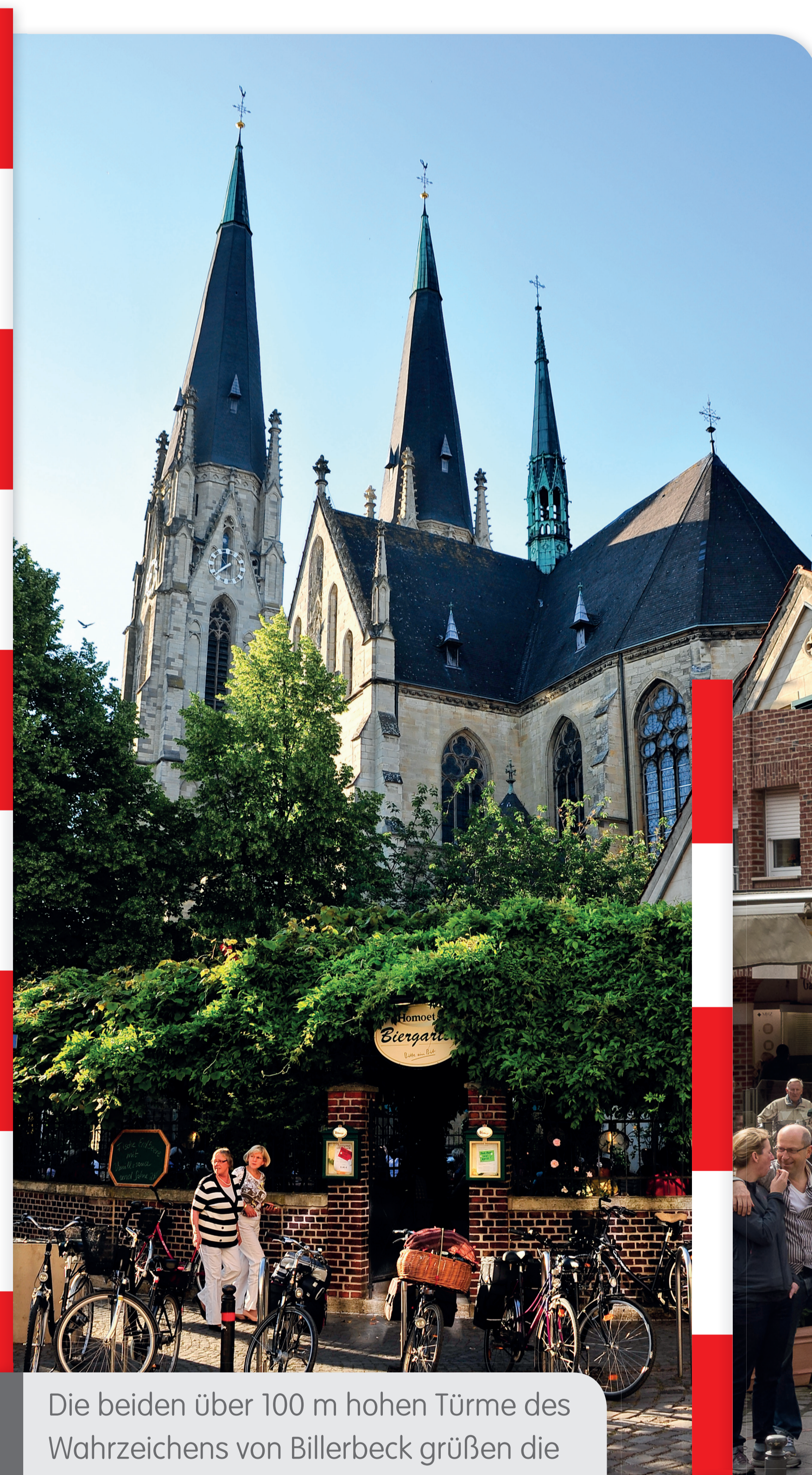
Die beiden über 100 m hohen Türme des Wahrzeichens von Billerbeck grüßen die Radtouristen bereits aus der Ferne.

Mit „Liudger“, dem ersten Bischof von Münster, fing alles an: 809 in Billerbeck verstorben, entwickelte sich die Stadt sehr schnell zum Wallfahrtsort. Schon von Ferne sollten die Wallfahrer Billerbeck erkennen. Daher entstand der mächtige Billerbecker Lugerusdom, der in den Jahren 1892 bis 1898