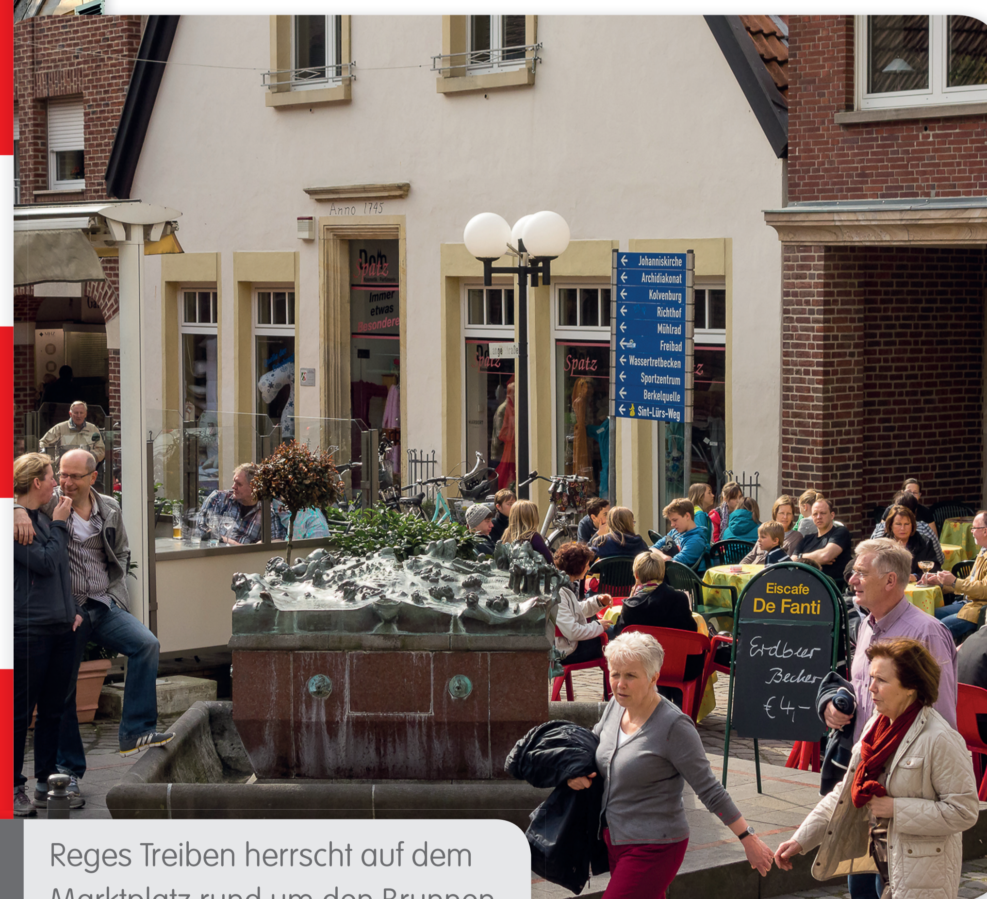
Reges Treiben herrscht auf dem Marktplatz rund um den Brunnen.

in Form einer neugotischen Basilika erbaut wurde. Zu erreichen ist er über die „100-Schlösser-Route“ als auch über die „Sandsteinroute“ und den Berkelwanderweg.